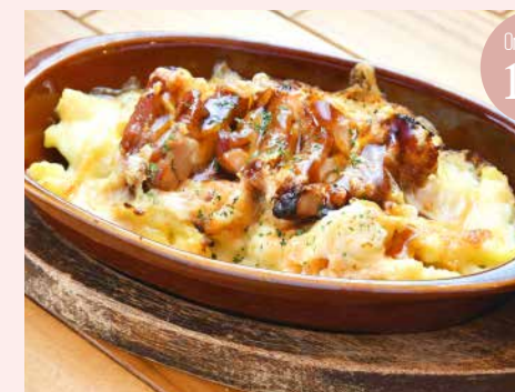
Order No. 152