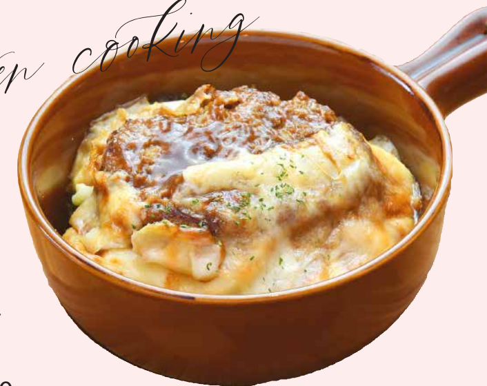
Order No. 151