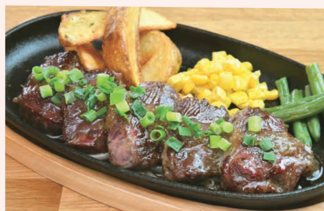
倍盛り牛サガリカットステーキ

Order No. 101 牛サガリカットステーキ(和風) 柔らかな肉質のサガリをカットして食べやすくしました。自家製和風ソースです。 ビジター ¥1,600 メンバーズ ¥1,280