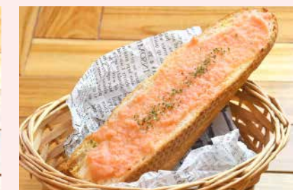
Order No. 212 ガーリックトースト

ニンニクの香りがきいた、サクサクのバケット。メインディッシュと一緒にいかがですか?