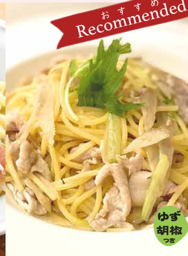
Order No. 139 ゴボウと豚肉の和風パスタ