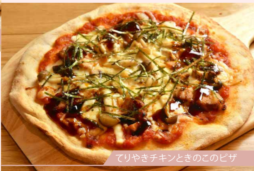
てりやきチキンときのこのピザ

てりやきチキンときのこのピザ たっぷりのきのこをトッピングして、 コクのある照り焼きソースで仕上げました。 ピジター ¥1,600 メンバーズ ¥1,280