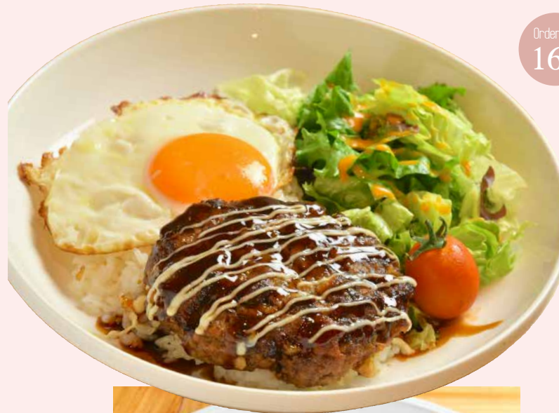
Order No. 160

ロコモコどんぶりテリやきハンバーグ 照焼ソースで仕上げたハンバーグを、ロコモコどんぶりにしました。