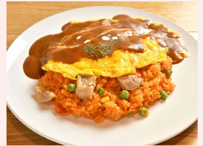
Order No. 161

とろとろたまごのチキンオムライス チキンライスとデミグラスソース。定番のオムライスです。