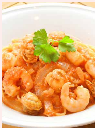
Order No. 134 エビとホタテのトマトクリームソース