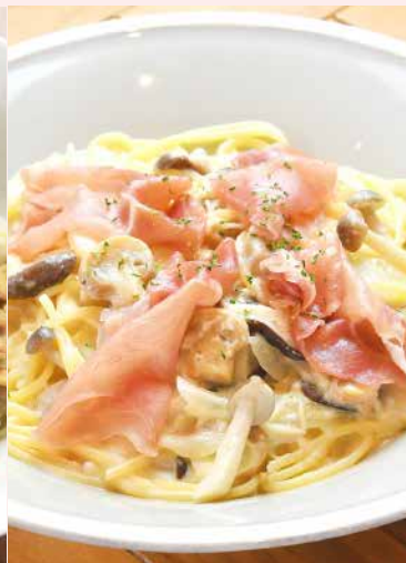
Order No. 136 生ハムときのこのクリームソース