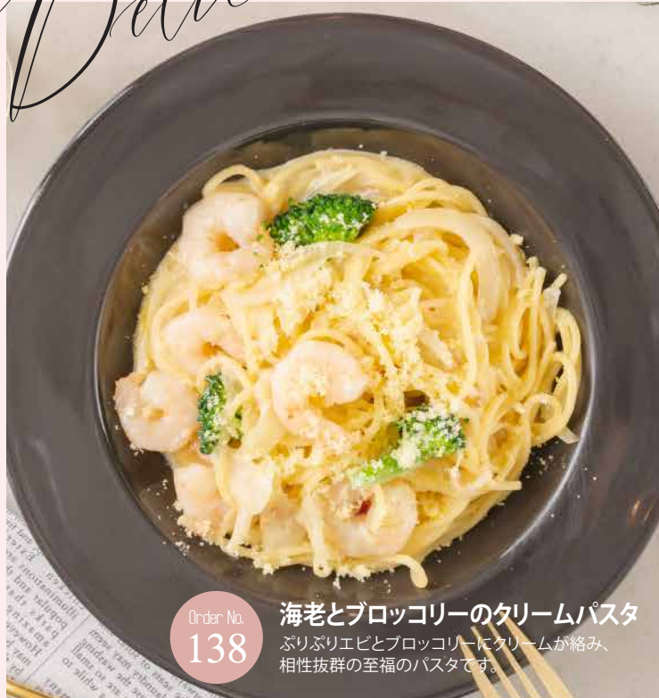
Order No. 138 海老とブロッコリーのクリームパスタ ぶぶりエビとブロッコリーにクリームが絡み、相性抜群の至福のパスタです。