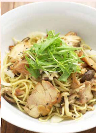
Order No. 135 照り焼きチキンとキノコの和風ソース