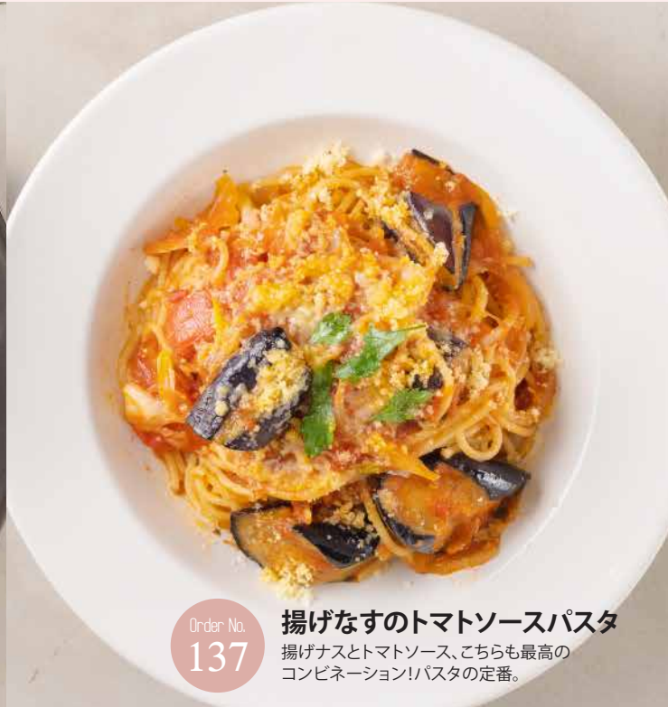
Order No. 137 揚げなすのトマトソースパスタ 揚げナスとトマトソース、こちらも最高のコンビネーション!パスタの定番。