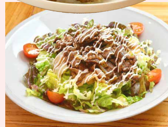
Order No. 162